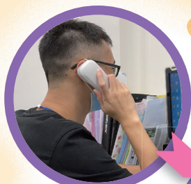
收到求助電話或轉介信，專責社工/護士盡快跟進