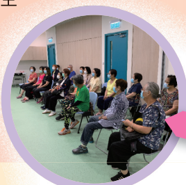
地區茶敘和家庭活動加強同路人互助互勉的精神、促進家庭和諧、增進感情

本機構於 11 月開展癌症患者支援計劃，旨在有效協助癌症患者及其家庭適應因癌症帶來的生活影響和轉變，減輕壓力和困擾，重新主導生活，以致提升生活質素。此計劃針對現行醫療照顧的不足，為癌症患者及其家庭，提供適時、切合需要且持續性的支援服務。