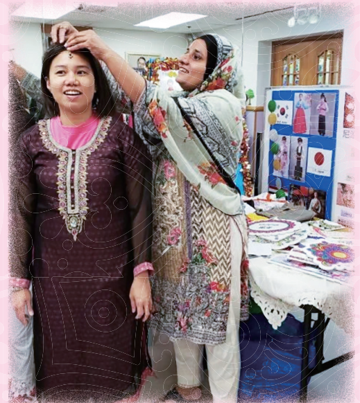
本地華語及非華語家長透過活動加深對彼此的認識，促進社會共融。（攝於疫情前）

校園共融有賴家校合作，只要大家都多走一步，配合適當支援，便能打破隔膜。（攝於疫情前）