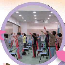
修身養心賦能課程強化病者及家人的心理健康和應付能力，改善生活質素，減低對死亡的恐懼