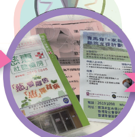
護理及飲食資訊加強抗癌知識，給予有需要的病者營養補充品增強抗癌能力