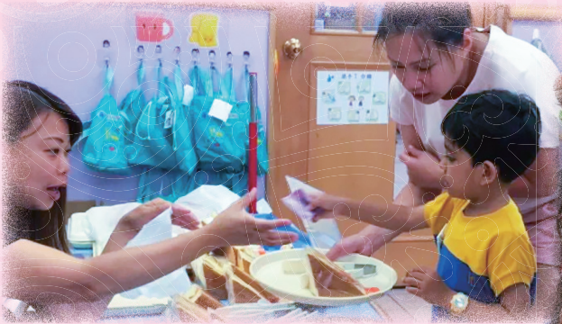
非華語學童能透過遊戲和度身訂做的課程，有效學好中文。（攝於疫情前）

如欲獲取更多有關「賽馬會友趣學中文」計劃的資訊，請瀏覽網頁 www.c4chinese.hk ，或 Facebook 專頁（賽馬會友趣學中文 C-for-Chinese at JC）。