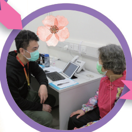
專責社工/護士為病者/家人作出初步評估，並以病者為中心、家庭為本，給予適切的輔導及協助