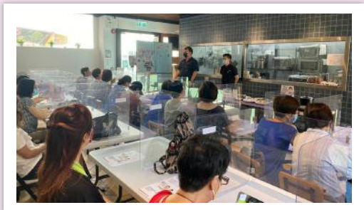
▲本機構之「麥理浩餐廳」定期舉辦工作體驗日

香港聖公會麥理浩夫人中心自2016年4月1日起開始擔任「ERB服務點」(葵青及荃灣)的統籌機構，與10間地區組織協作設立「ERB服務點」，本機構同工會前往每個服務點當值，為市民提供查詢及報讀培訓課程服務，亦會定期舉辦行業講座及試讀班，以及預約培訓顧問服務等。於2023-24年度(截至2023年11月)，共有約480人次透過「ERB服務點(葵青及荃灣)」報讀僱員再培訓局課程，並舉辦了40個行業講座及試讀班，共超過800名市民出席。