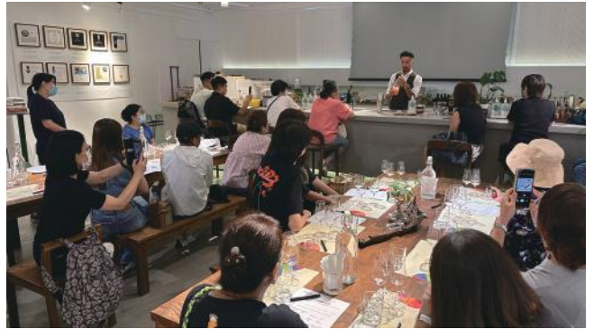
▲就業實戰系列活動報名情況踴躍

新一年度本機構將一如以往繼續與社區組織攜手合作，進一步在地區各層面向推廣ERB課程和服務，與市民一起培訓增值，共創佳「職」。