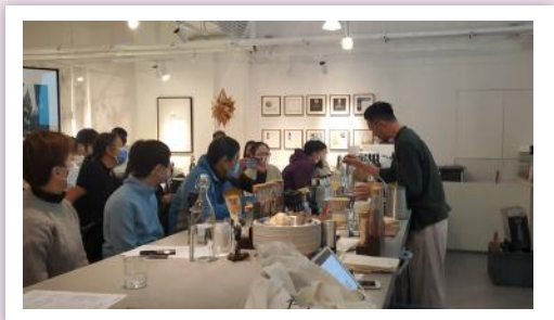
▲學員投入參與工作體驗日

服務點亦會為特別需要社群，包括青年人、「後50」、新來港人士及婦女等舉辦「就業實戰系列活動」，透過「就業規劃工作坊」、「行業講座及試讀班」及「工作體驗日」等不同元素的活動，提升參加者對就業市場的認識及了解工作實況。