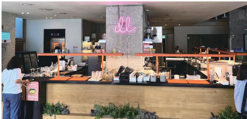
▲筆者參訪韓國社企餐廳Chillu Chillu 時攝